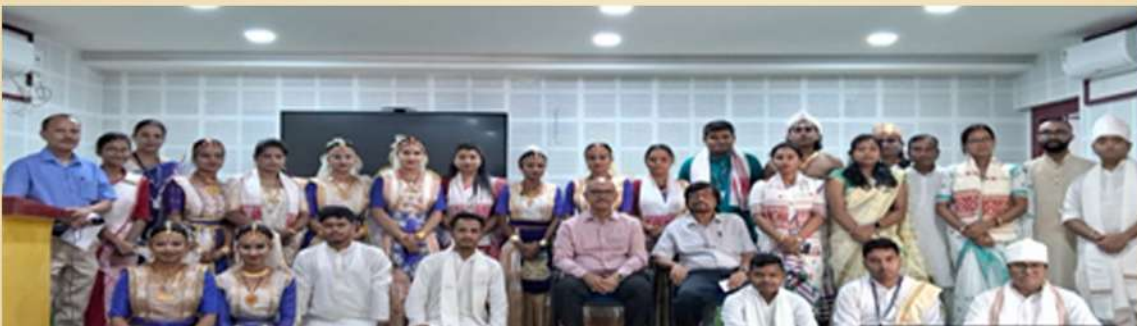
Celebrating 1st Foundation Day of the Department, Name of the event is "SURJAATRA- A JOURNEY OF RHYTHM" on 20 oct, 2024 at KAV Auditorium.