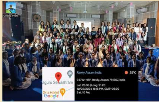
Students Extension Programme with Gauhati University