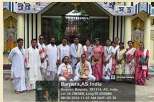
Field study by the students of the department at Sattras of the Barpeta District, on 26 August 2024.