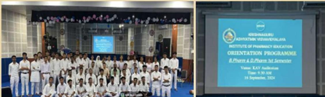
Orientation Programme for B Pharmacy and D Pharmacy