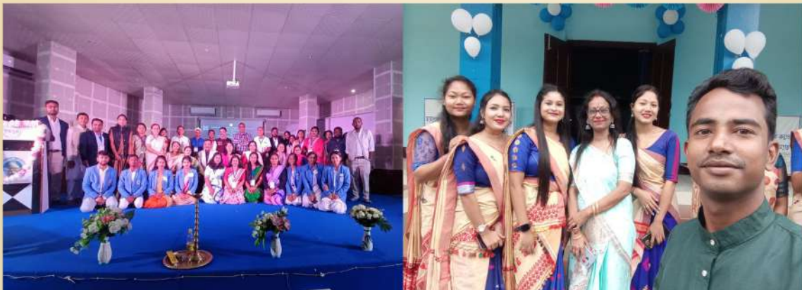
Glimpses from the celebration of ICPR-Sponsored World Philosophy Day at the University.